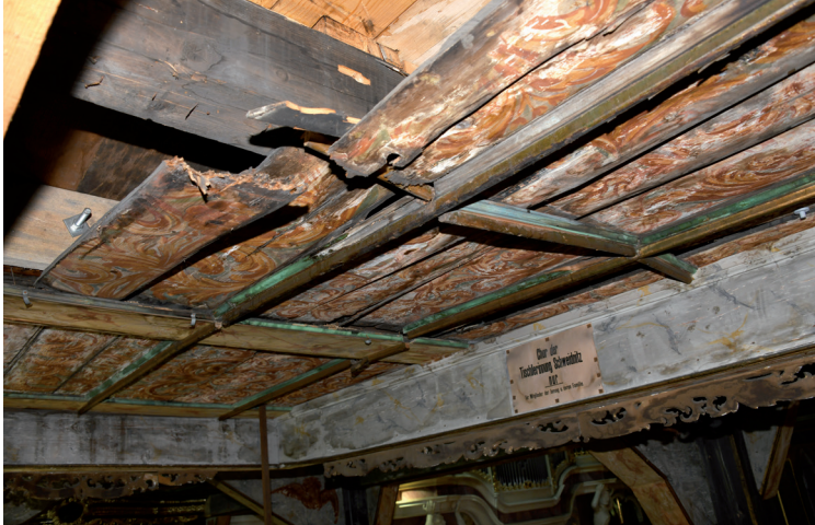
Destrukcyjna struktura i polichromii stropów spowodowana przeciekaniem wody przez uszkodzenia pokrycia dachowego