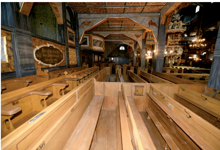
Hala Polna – fragment, strona północna kościoła, poziom przyziemia, stan po konserwacji, rok 2021

epitafiów, tablic cechowych i tarcz herbowych, 145 XVII-wiecznych ławek wraz z podłogami, schodami, posadzkami, wiele polichromowanych stropów i drewnianych polichromowanych okładzin ścian.