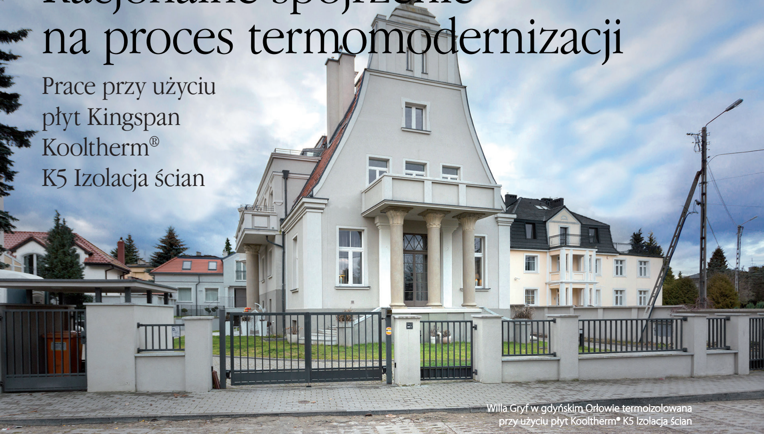
Willa Gryf w gdyńskim Orłowie termoizolowana przy użyciu płyt Kooltherm® K5 Izolacja ścian

Prace przy użyciu płyt Kingspan Kooltherm® K5 Izolacja ścian