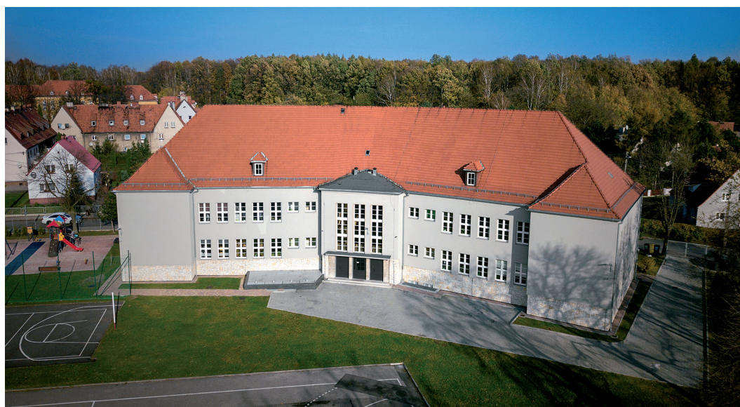
Zabytkowy budynek Szkoły Podstawowej nr 2 w Gliwicach poddany termoizolacji przy użyciu płyt Kooltherm® K5 Izolacja ścian

https://www.kingspan.com/pl/koolthermk5-kampania