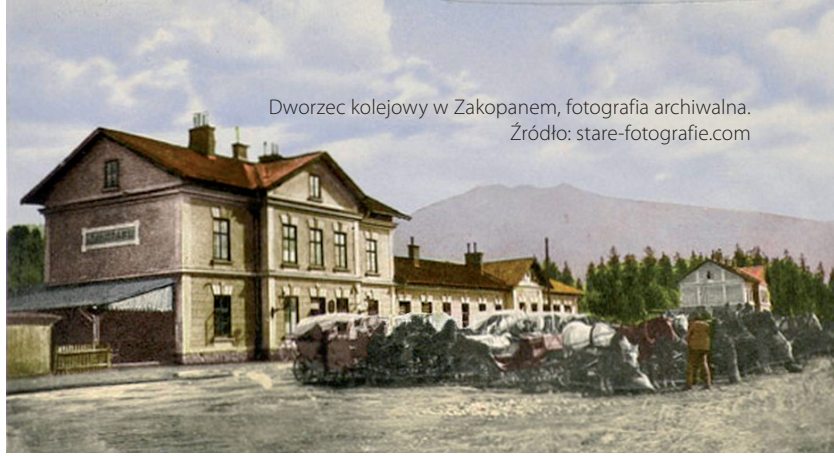
Dworzec kolejowy w Zakopanem, fotografia archiwalna.