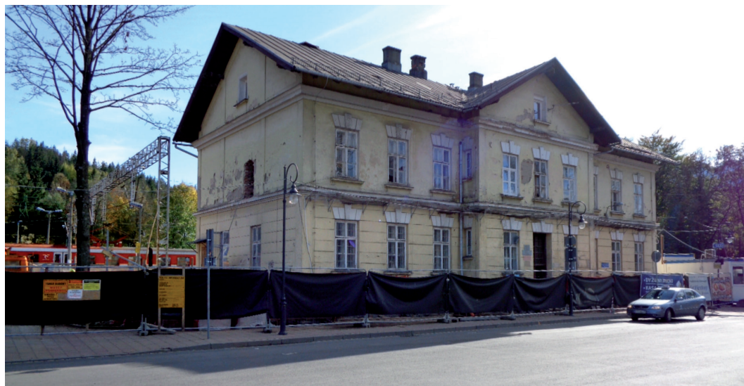
Remontowany budynek dworca w Zakopanem

Ekspertsi Kingspan, czerpiąc z wiedzy obiektywnej i własnych doświadczeń zawodowych, dysponują kompleksowym narzędziem, wspomagającym właściwe podejście do tego typu zadań. Dzięki temu potencjałowi zabytki są w stanie generować wymierne korzyści materialne – są przedmiotem korzystania użytkowego, tworzą miejsca pracy, ale też przynoszą dochody. Budynek dworca kolejowego w Zakopanem, po przejściu wielu skomplikowanych procedur ze względu na wpisanie obiektu do rejestru zabytków, doczekał się kompleksowego remontu pod konserwatorskim nadzorem. Przeprowadzając prace termomodernizacyjne całego obiektu, zadbało o to, aby zewnętrzny wygląd budynku nie zmienił się.