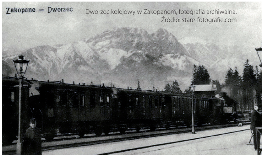
Zakopane — Dworzec