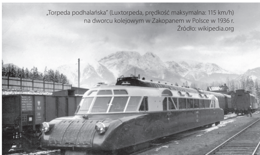
„Torpeda podhalańska” (Luxtorpeda, prędkość maksymalna: 115 km/h) na dworcu kolejowym w Zakopanem w Polsce w 1936 r.