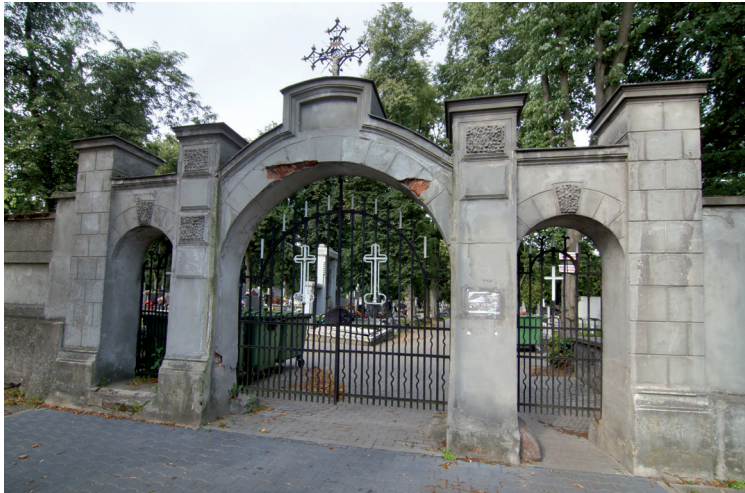
Widok bramy nr 1 przed i po remoncie.

Na bazie badań, wykonanych przez firmę Farby Kabe, określono precyzyjnie stan zawilgocenia oraz zasolenia. Dużym wyzwaniem był fakt, że bramy to obiekty wolnostojące oraz