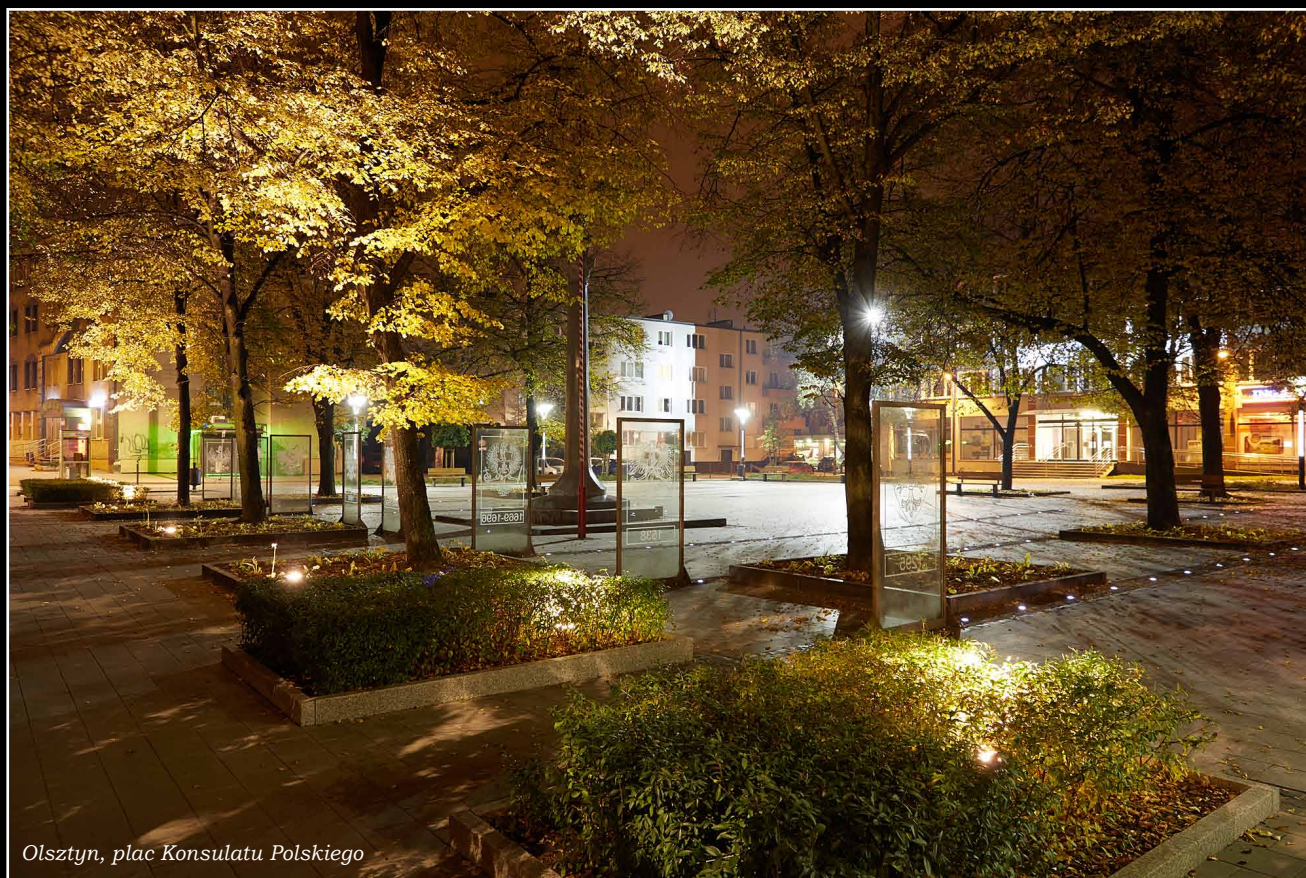
Olsztyn, plac Konsulatu Polskiego