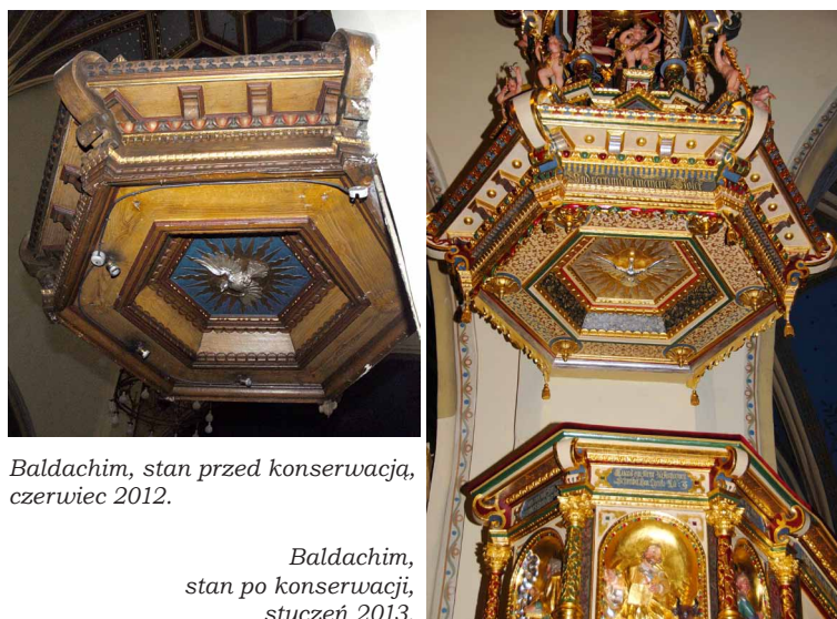
Baldachim, stan przed konserwacją, czerwiec 2012.