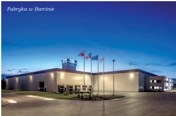
Fabryka w Barcinie