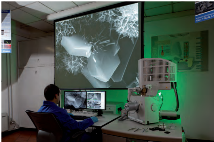
Laboratorium w Mediolanie